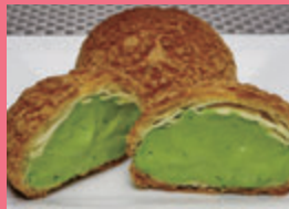
堀川製茶(あわら市) 宇治抹茶クッキーシュークリーム 他