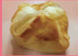
甘党本陣 嵯峨(あわら市) もちパイ 他