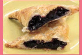
瑞香園(あわら市) 手作りブルーベリーパイ 他