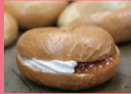
クリーンねっと金津 コサエルばーしもん(あわら市) 「うめ〜ぐる」他 ※11日(土)のみ出店