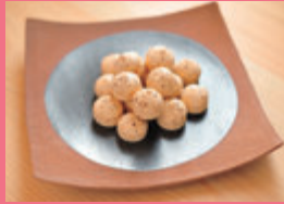
浅野耕月堂(あわら市) 「松の露」他