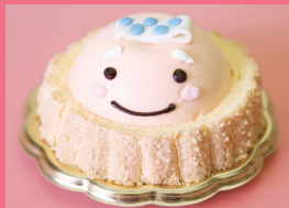
西洋菓子倶楽部(坂井市) マルシェ限定スイーツ 他