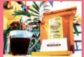
UchiLaLa(ウチララ)(あわら市) コーヒー、ジュース 他