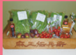
麻王伝兵衛(あわら市) 越のルビー 他