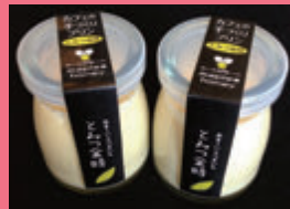
メープルハニー(福井市) とみつ金時プリン