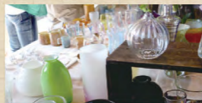
ガラス大バザール 販売風景