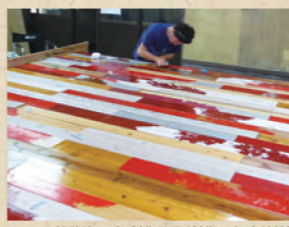
眞壁陸二氏 制作風景(創作の森 宿泊棟)

日時 10月11日(日) 14:00~14:30 会場 アートコア ミュージアム-2 イベントテラス 【参加無料】 定員 20名 13:30~会場にて受付 ※定員に達し次第切 世界各国のドラムやパーカッション楽器を使って即興演奏を楽しみましょう! ※音楽経験等は問いません。 講師 山口紀子(金津創作の森入居作家/作曲家・音楽監督) 後援・協力:ドラムサークル福井(代表 加藤譲史)