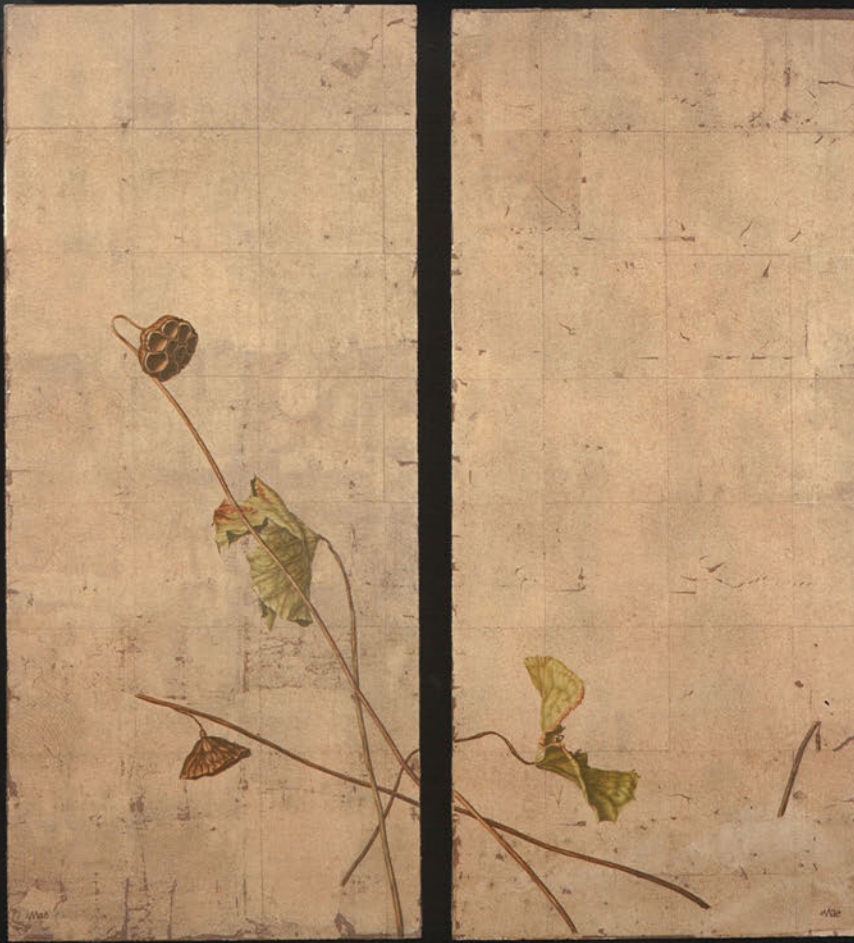
前 壽則 左:『蓮池』1/4 (No.228) 右:『蓮池』2/4 (No.229)