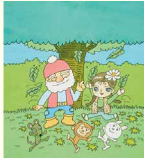
「ガンバリおじさんとホオちゃん」