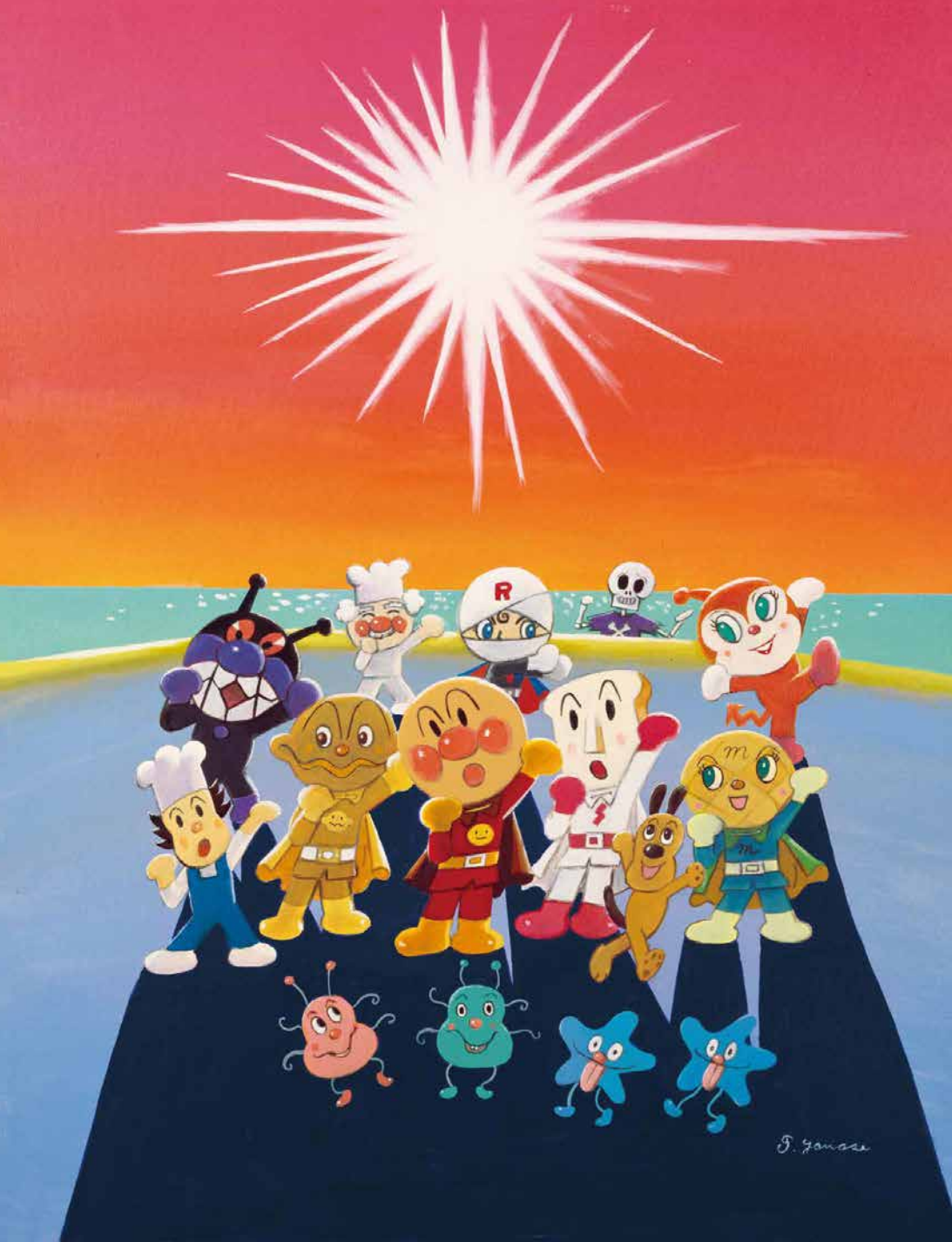
「手のひらを太陽に」©やなせたかし(公財)やなせたかし記念アンパンマンミュージアム振興財団所蔵