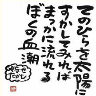
「てのひらを太陽に」