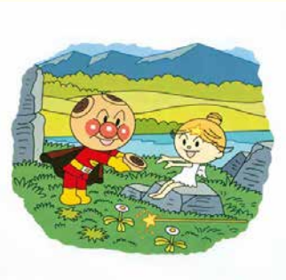
「アンパンマンとふたごのほし」

画像はすべて©やなせたかし(公財)やなせたかし記念アンパンマンミュージアム振興財団所蔵