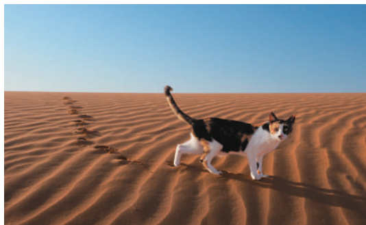
アラブ首長国連邦/アル・アイン