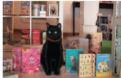
スペイン/マドリード