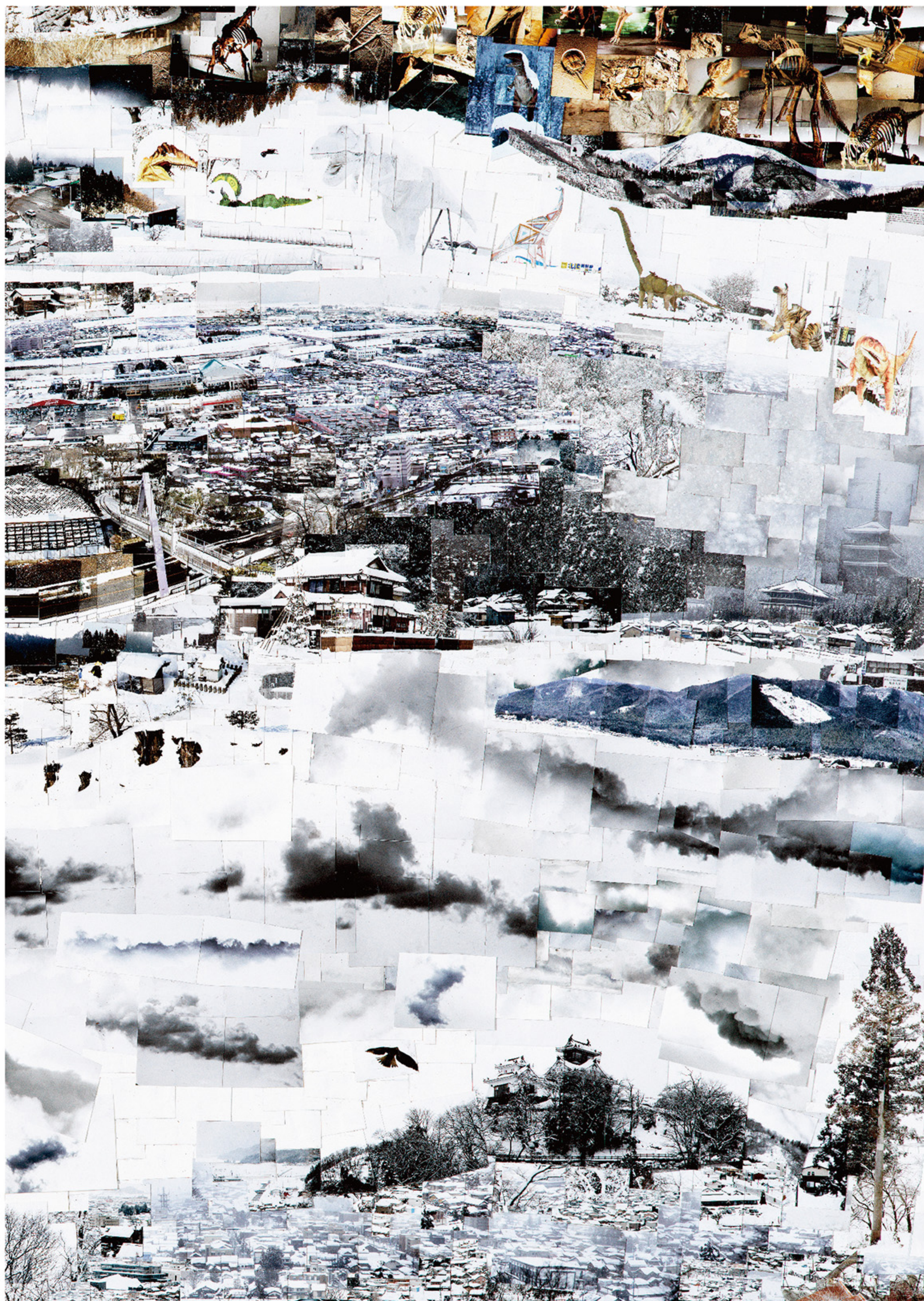
《北陸道》(部分) 2022 © Sohei Nishino