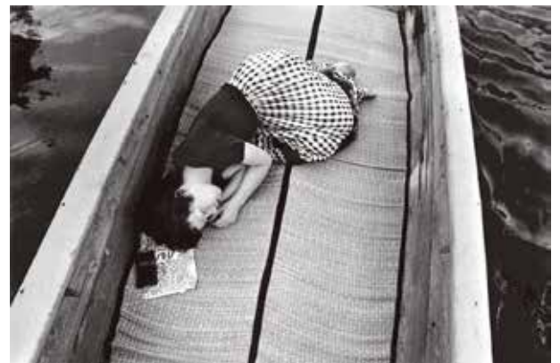
荒木経惟 〈センチメンタルな旅〉より/1971年