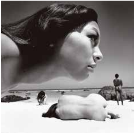
篠山紀信 〈誕生〉より/1967年