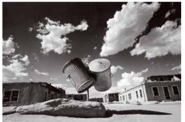
奈良原一高 〈消滅した時間〉より 二つのゴミ缶、ニューメキシコ /1972年