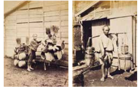
下岡蓮杖 〈The Far East〉より 「果物売り(左上)」、 「籠売り(右上)」、 「ブリキ職人(左下)」、 「醤油売り(右下)」 /1860年代半ば