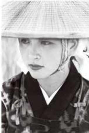
木村伊兵衛 秋田おぼこ 秋田・大曲/1953年