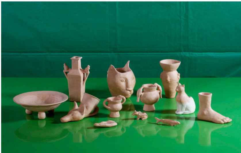
《テラスの土器》2025 素焼き粘土