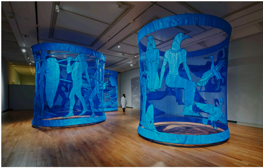
《ヒト新世の群像》2022 ブルーシート、シート紐、糸、ハトメ